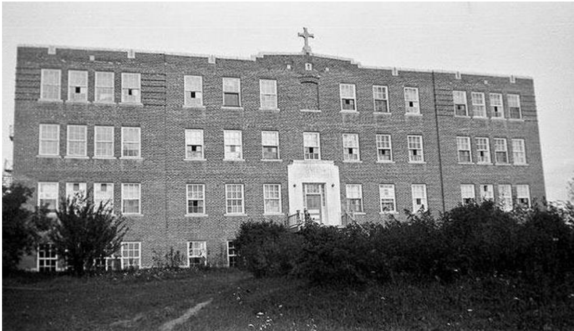
Pensionnat indien Beauval, Nord de la Saskatchewan, 1951

« Lorsque l'on vous dépouille de votre innocence, que l'on dénigre votre peuple, que l'on dénonce votre famille d'origine et que l'on qualifie d'arriérés, de primitifs et de sauvages vos coutumes et vos rituels tribaux, vous finissez par croire que vous êtes moins qu'humain ». Ce sentiment d'indignité, c'est l'enfer sur terre. Voilà ce qu'ils [les pensionnats] nous ont infligé. Cheval indien par l'auteur ojibwé Richard Wagamese